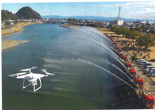
焼津市消防団出初式